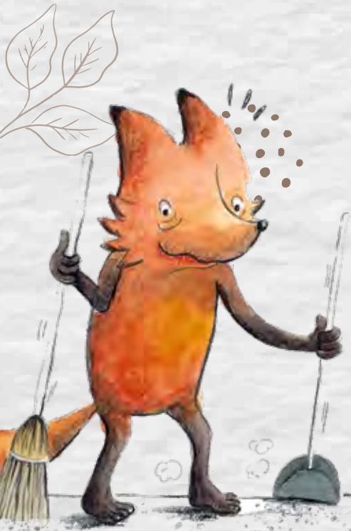
Ilustración del libro "Zorrizo The path of the hedgefox".