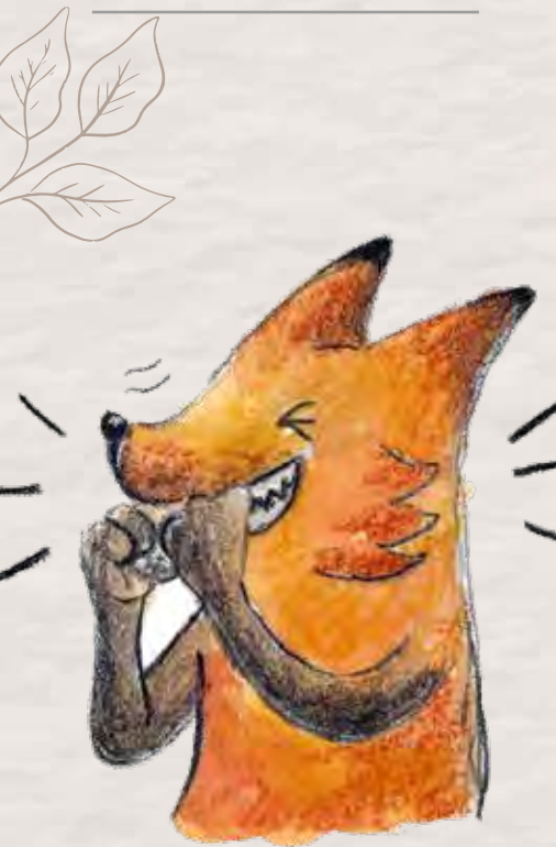
Ilustración del libro "Zorrizo The path of the hedgefox".