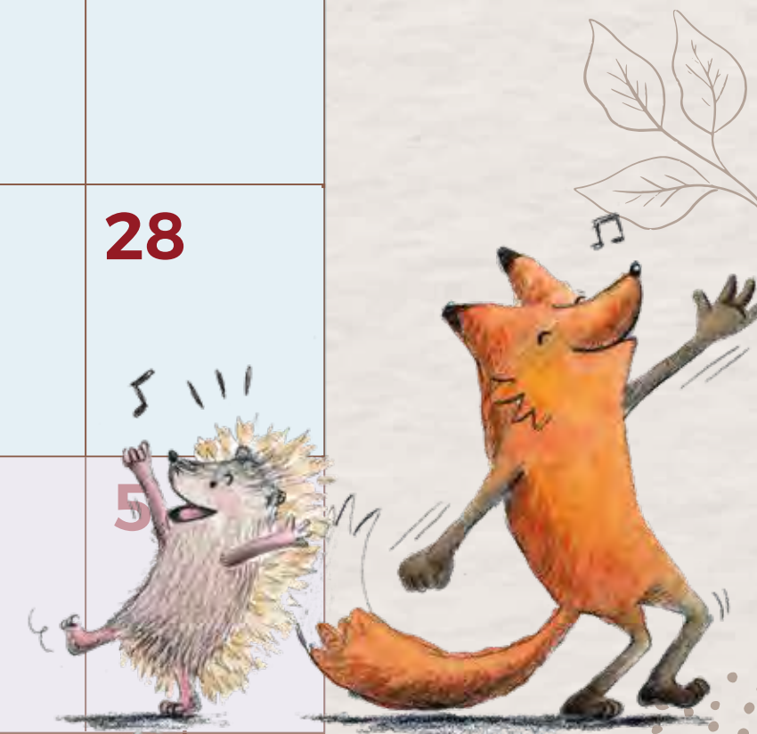
Ilustración del libro "Zorrizo. The path of the hedgefox".