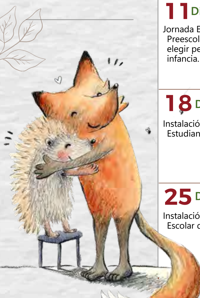
Ilustración del libro "Zorrizo. The path of the hedgefox".