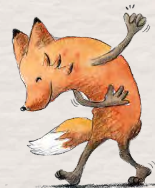
Ilustración del libro "Zorrizo The path of the hedgefox".