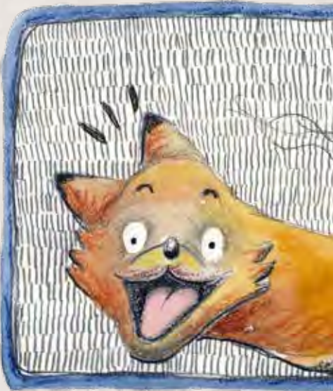
Ilustración del libro "Zorrizo The path of the hedgefox".