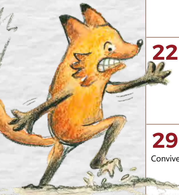
Ilustración del libro "Zorrizo The path of the hedgefox".