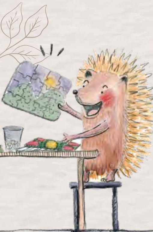
Ilustración del libro "Zorrizo The path of the hedgefox".